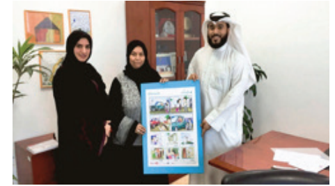
إهداء إلى نيابة الأسرة والطفل

تم تصميم بوستر للحملة يحتوي على جميع رسومات الكاريكاتير التي تم تصميمها للحملة، وقمنا بإهداءها لبعض الجهات المهتمة بالطفولة وبعض المدارس.